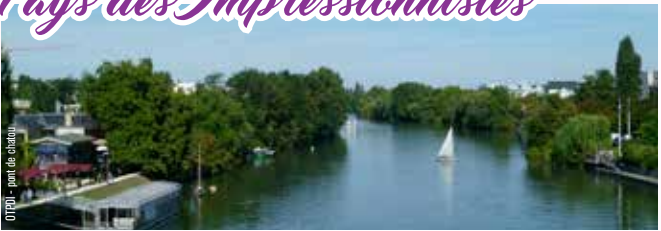
pont de Chatou

Vous trouverez le Pays des Impressionnistes dans le département des Yvelines, en Île-de-France. Il comprend sept villes regroupées autour de la Seine, qui ont inspiré de nombreux peintres à Carrières-sur-Seine, Chatou, Croissy-sur-Seine, Le Pecq, Le Port-Marly, Louveciennes, Marly-le-Roi. L'un d'eux fut le célèbre Pierre-Auguste Renoir.